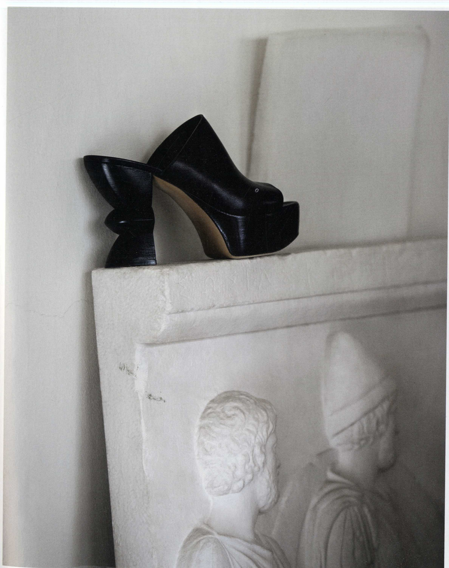
Plateau aus Kalbleder mit skulpturalem Absatz, um 705 €, von SALVATORE FERRAGAMO

VOCUE dankt dem Museum für Abgüsse Klassischer Bildwerke München