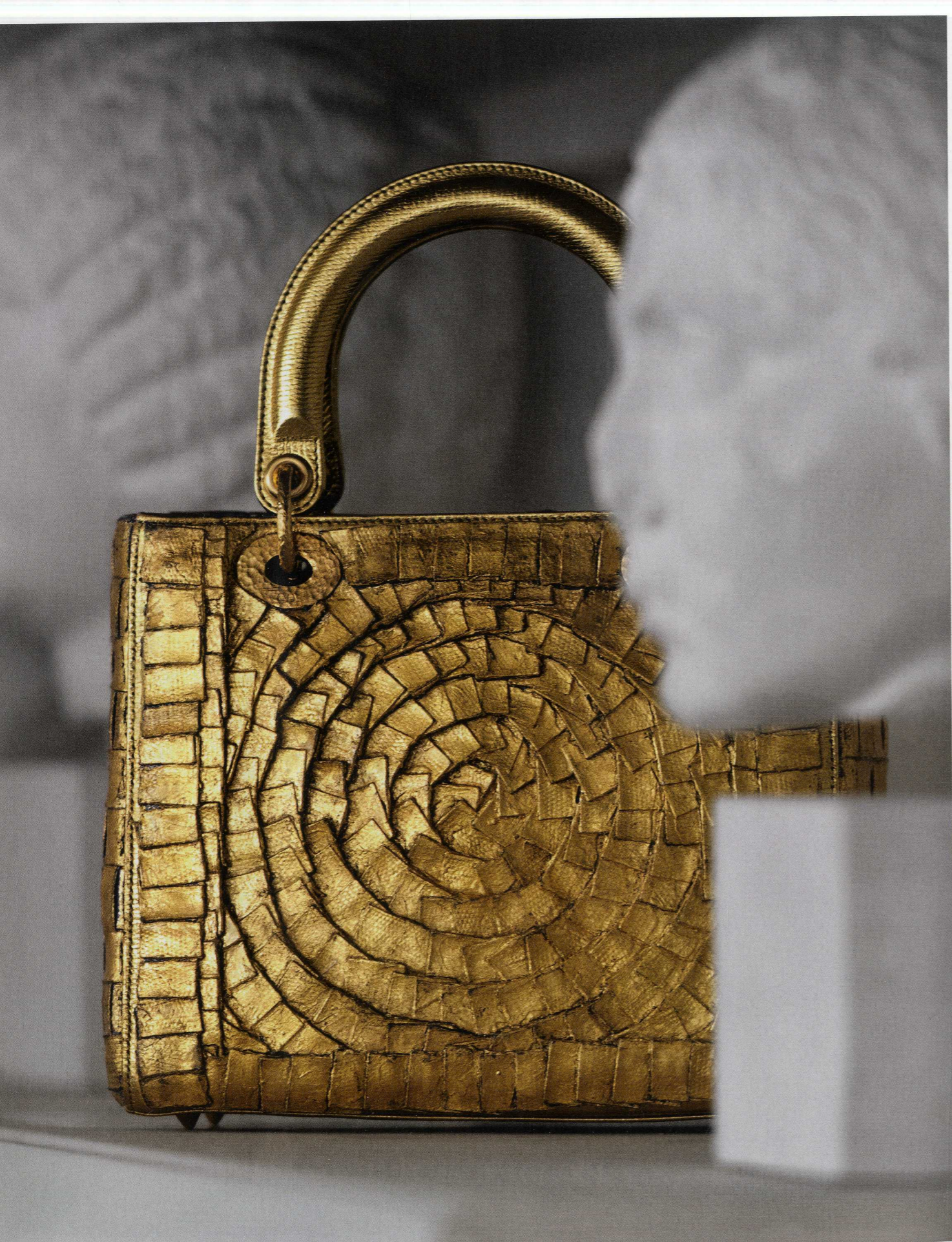
Tasche aus Baumwolle mit einer 24 Karat Vergoldung, um 16.000 €, von DIOR

VOCUE dankt dem Museum für Abgüsse Klassischer Bildwerke München